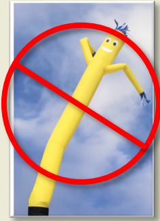
Inflables en movimiento