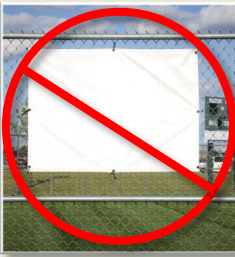
Colgado en cercas